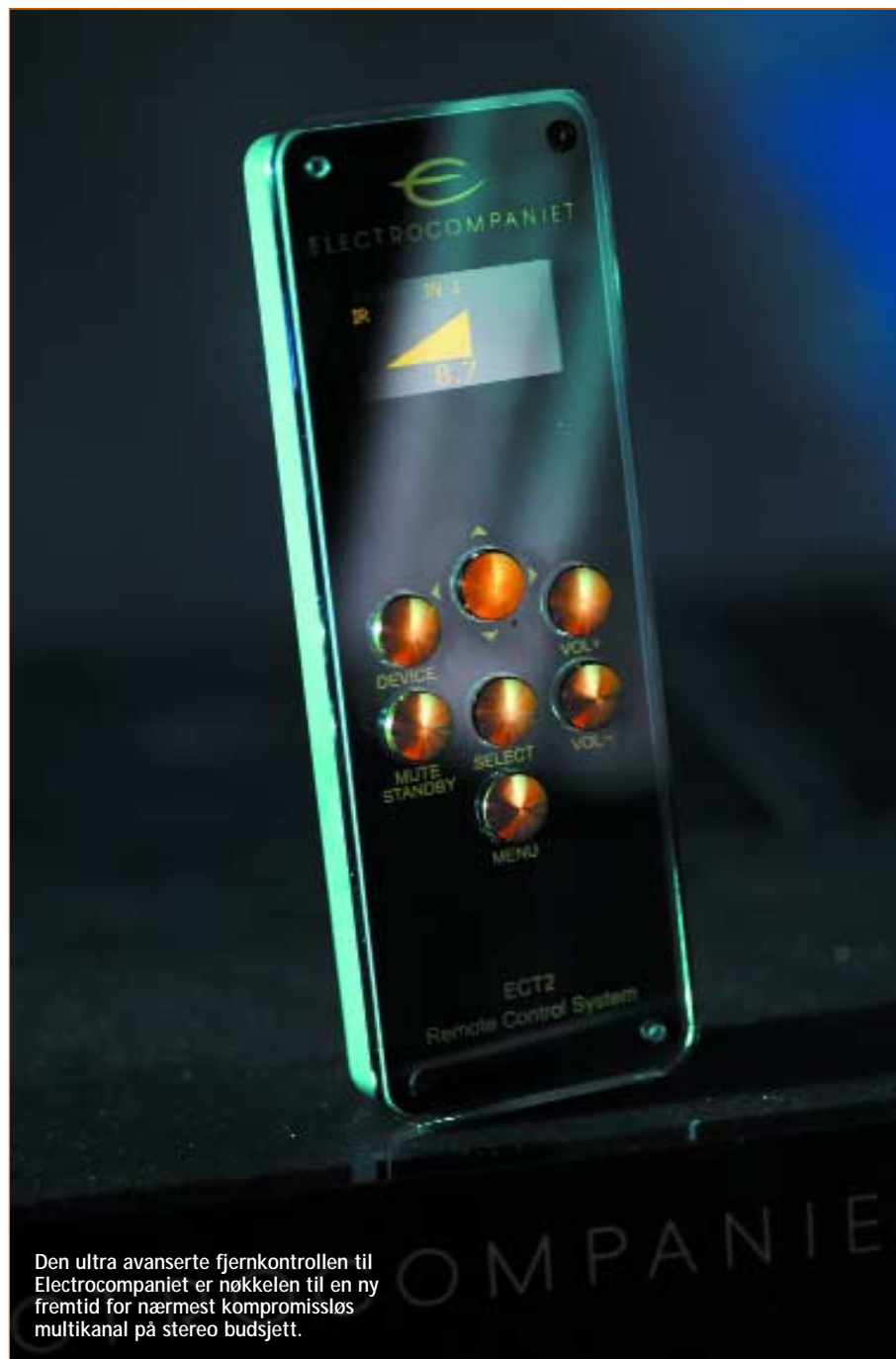
Den ultra avanserte fjernkontrollen til Electrocompaniet er nøkkelen til en ny fremtid for nærmest kompromissløs multikanal på stereo budsjett.